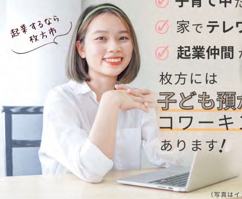
(写真はイメージです。)