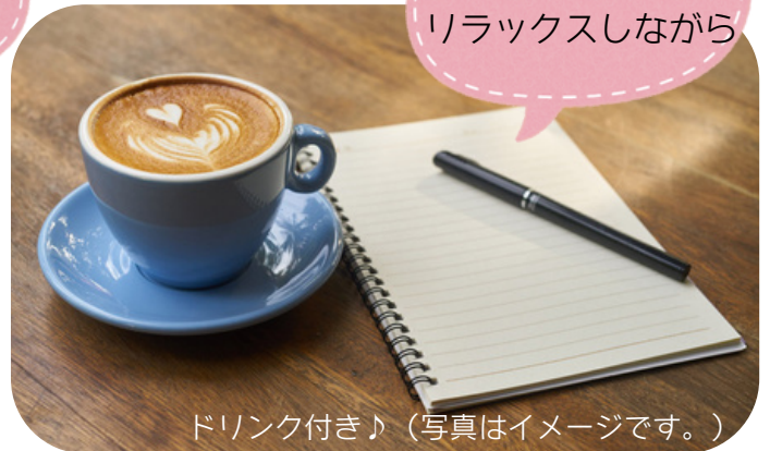
ドリンク付き♪ (写真はイメージです。)